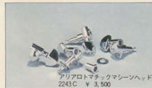
アリアロトマチックマシンヘッド 2243C ¥3,500

シンプルなD-28モデルはW-50、華麗なD-41モデルはW-50D、共に力強いバス、澄みきったハイトーンは抜けが良く、オリジナルの内容をもそっくり自分のものにしていきます。腰の強いスプルース単板にのみ求められる余裕のあるポリウムは、ハードなストロークブレイにもバランスがよく(W-45まで)、あくまでナチュラルでマイルドなトーンのマホガニーバックとのマッチングは最高とされ、音にうるさいプロ向きの「いぶし銀の味」を生み出します(W-50,45)。ボディ材質が音にとって決定的要素となっていると同様に弾き易さはネック機能にかかっています。ネックはあくまで強く、軽く、タッチのソフトな材質を追求、耐候性に優れたマホガニー材を使用しトラスロッドを内包、塗装はくいつきをなくしたツヤ消し仕上げがソフトなタッチにしています。あくまで楽器としての「内容あるギター製作」を貫いてきたアリアスタッフの理想の追求の結果がここにあるのです。