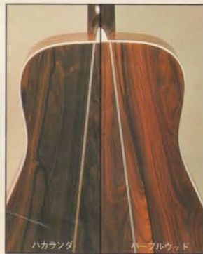
ハカランダ パープルウッド

ンパールインレイは25%から8%まで長さにより部分毎にカットしフィットさせた数は大変なもので、まさに芸術的ハンドクラフトです。又ギターの生命として重要な指板・フレットには理想的な400Rで仕上げられたエポニー指板にニッケルシルバーのフレットがしっかりと打ち込まれ、バインディングにのせたフレットエッジはコブシ状に仕上げているためエッジングはとてまぬからず。W-80に使用しているパープルウッド(バック&サイド)はブラジリアンローズの中からほんの少ししかとれない貴重な材料で木目の流れは大胆な美しさにあふれており、ローズ、ハカランダとはまた違った味を出しています。最もオーソドックスなスクウェアードヘッド