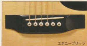
エポニーブリッジ

W-100とW-80はアリアの内容が全て集約されたマスターピースです。徹底的にセレクトされたソリッドスプルーストップ、最高級ハカランダ又はパープルウッドのバック&サイド、メキシカンパールのインレイ、エポニーブリッジとエポニー指板のマッチング、グローバー102のゴールド又はクロームプレートという完璧な仕様から生まれる音は気品に溢れ、華麗なトータルカラーをもつ最高傑作です。中でも、このクラスに使用しているメキシカ