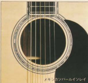
メキシカンパールインレイ

スプルース単板トップ/ローズ3ピースバック&サイド/マホガニーネック/ローズフィンガーボード/アリアロトマチックマシンヘッド2273C