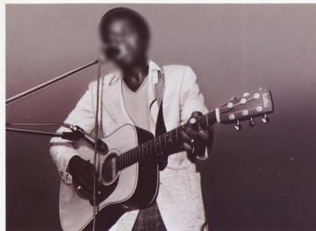
チャーリー・フライド

BLUE BELL 発売元 株式会社神田商会東京 東京都千代田区神田鍛冶町3-4-2 〒101 株式会社神田商会大阪 大阪市東区北久宝寺町5-51 〒541 株式会社神田商会札幌 札幌市中央区大通り東7丁目1番114-119 〒060