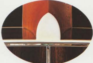
セル止めW-200(セル止めはTFシリーズ全機種)