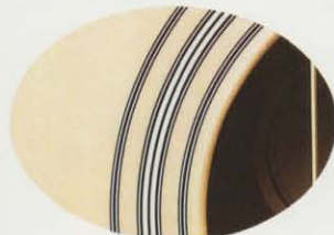
サウンドホールインレイ W-20