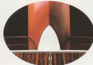
セル止め W-35(セル止めはWシリーズ全機種)