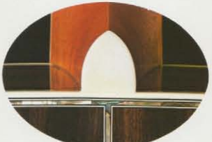
セル止め W-200 (セル止めはTFシリーズ全機種)