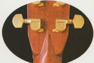
シャーラー糸巻及びダイヤカット W-250 (ダイヤカットはTFシリーズ全機種)