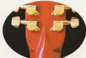
ダイヤカットB 100(ダイヤカットはB-50、60、80、100)