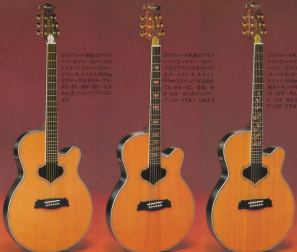
Z1 ¥80,000 GZ ¥100,000 GSZ ¥150,000