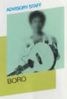
BORO ADVISORY STAFF

1Way & 2Way。ピックアップ・ストーリー トルネードの高性能ピックアップは2タイプ。弦振動をブリッジからダイレクトに拾うセラミック型CP-8Tとサウンド・ホール下部から拾うコンセンサー型CP-7Tを採用。1Wayは8Tのみ、2Wayは2タイプ併用でクリアーなアコースティック・サウンドをパワフルにアウトプットします。