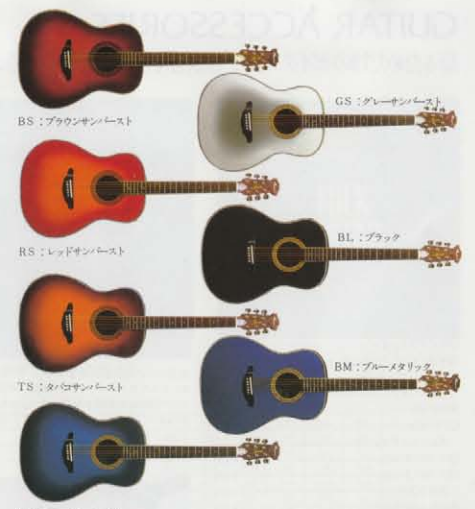
BS:ブラウンサンバースト GS:グレーサンバースト RS:レッドサンバースト BL:ブラック TS:タングサンバースト BM:ブルームタリック BU:ブルーサンバースト

1Way & 2Way。ピックアップ・ストーリー トルネードの高性能ピックアップは2タイプ。弦振動をブリッジからダイレクトに拾うセラミック型CP-8Tとサウンド・ホール下部から拾うコンセンサー型CP-7Tを採用。1Wayは8Tのみ、2Wayは2タイプ併用でクリアーなアコースティック・サウンドをパワフルにアウトプットします。