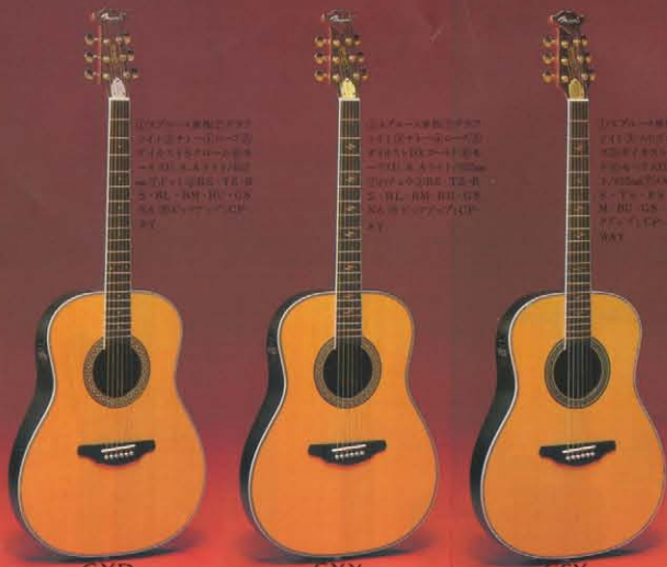
GXD ¥80,000 GXX ¥90,000 GSX ¥100,000