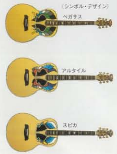
(シンボル・デザイン) ベガサス アルタイル スピカ

誰んでもカスタム・モデル熱望派に絡ぐ あなたの個性を反映したカスタム・モデルがオーダーできるトルネード・スペシャル・アイテムとして、新たにオーダーメイド・システムによる最高級オール・ハンド・クラフト・アイテム(メジャー・サ・ライン)誕生。ギター・ルックスを決めるトップのカラーリング&シンボル・デザインを、お好みに合わせてセレクト・オーダーできる画期的なニュー・アイテムです。しかも、サウンドも圧倒的に充実。メジャー独自のダブル・サウンド・ホールの採用で弦振動がよりダイレクトにボディに伝わり、ワイド独特のタイト&クリアーなサウンドを微妙なタッチまで絶妙のバランスであざやかにアウトプット。プレイヤーの個性を尊重するモリスにして初めて実現できた待望のニュー・アイテムです。カラダ電気のカラーリング、シンボル・デザインのなかから、お好みのものをお選びになり所定の用紙にて弊社までお申込み下さい。詳しくは以下のモリス・ギター・取り扱い楽器店にておたずねください。