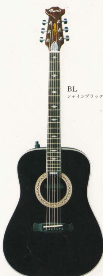
BL シャインブラック