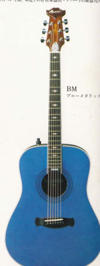
BM ブルーメタリック