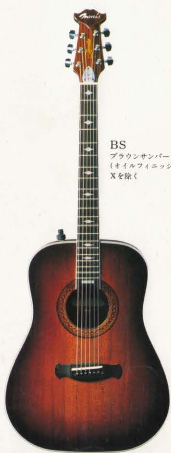
BS ブラウンサンバースト (オイルフィニッシュ) Xを除く

●カラー及びサンバースト仕上げについては、お近くの有名楽器店・デパートの楽器売場