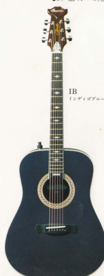
IB インディゴブルー