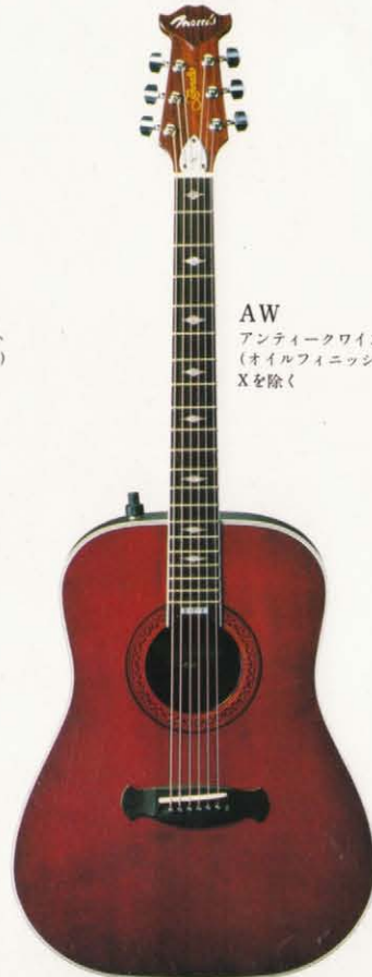
AW アンティークワイン (オイルフィニッシュ) Xを除く