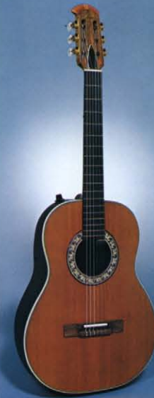
Electric Classic 1613-4 Natural ゴールドメッキ糸巻: アイボリーバインディング: ウォルナットブリッジ: トーン及びボリュームコントロール機構: ステレオアンプリファイ用2アウトプット機構