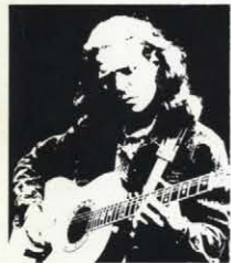
Glen Campbell 12 String 1118-4 Natural 真珠貝象眼: 24K極上ゴールドメッキ糸巻: アイボリーバインディング: 補強ローズウッドブリッジ ★ Electric Glen Campbell 12 String (1618-4 Natural トーンコントロール装備) もあります。