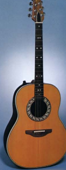
Electric Custom Balladeer 1612-4 Natural 真珠貝象眼: テラックスクロームメッキ糸巻: アイボリーバインディング: ウォルナットブリッジ ★ 1612-1 (Sunburst) 1612-2 (Red) もあります