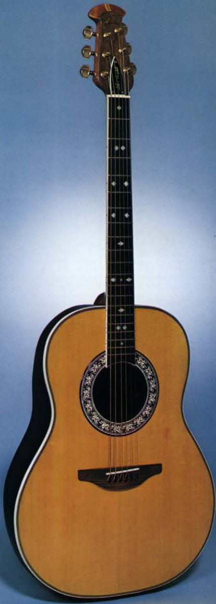
Glen Campbell Artist 1127-4 Natural