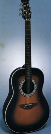
Artist 1121-1 Sunburst 真珠貝象眼: テラックスクロームメッキ糸巻: アイボリーバインディング: ウォルナットブリッジ ★ 1121-4 (Natural) もあります