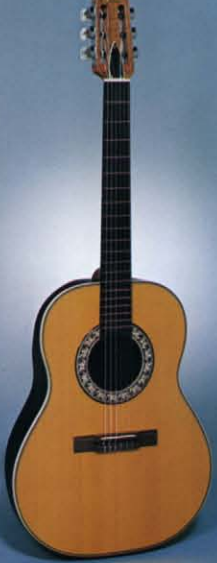
Country Artist 1124-4 Natural テラックスクラシック糸巻: アイボリーバインディング: ウォルナットブリッジ