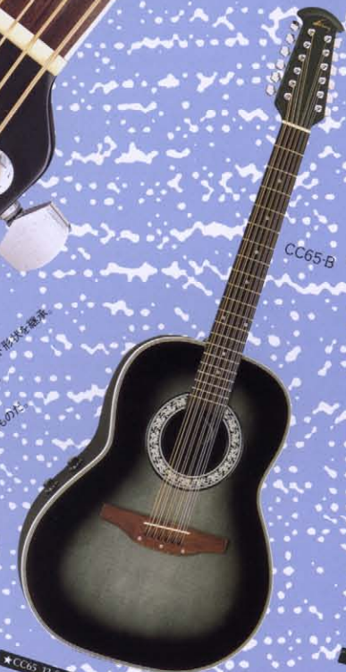
★CC65 12-String Deep Bowl (Color:-1,-4,-5,-B)

ヘッド CELEBRITY ULTRAは、有名アーティストの選定による それは、このギターに2000以上の小时の選定による ギターヘッドは、2000以上の小时の選定による 最も安定したチューニングをします。また高精度のものだ