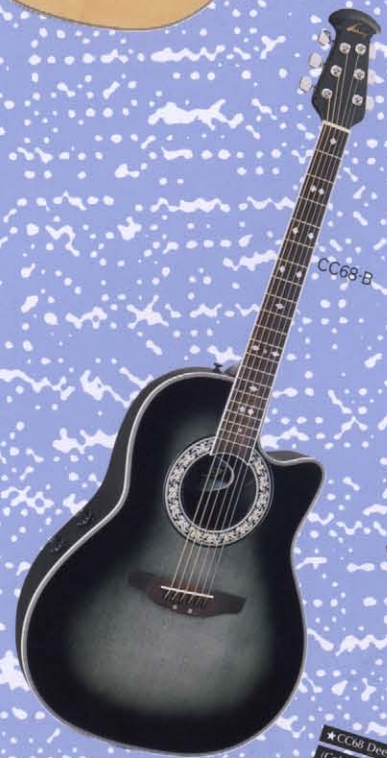
★CC68 Deep Bowl Cutaway (Color:-1,-4,-5,-B)