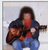
★STEVE LUKATHER/TOTO/U. S. A.

★トップ=ローズウッド ★サイド&バック=アッシュ ★フィンガーボード=ローズウッド ★ブリッジ=ローズウッド ★ネック=マホガニー ★マシヘッド=三浦コールド ★ピックアップ=PALATHETIC® ★コントロール=ゲインX1 トレブルX1 ベースX1 ★カラー=ナチュラル(N)