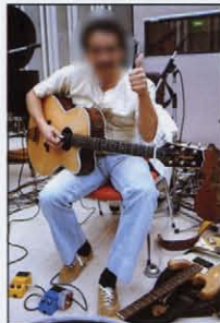
★JOHN TROPEA/U. S. A.

★トップ=シカモア ★サイド&バック=シカモア ★フィンガーボード=ローズウッド ★ブリッジ=ローズウッド ★ネック=マホガニー ★マシヘッド=タカミネオリジナル ★ピックアップ=PALATHETIC® ★コントロール=ゲインX1 トレブルX1 ベースX1 ★カラー=ナチュラル(N)