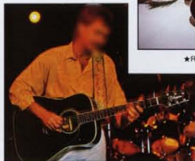
★STEVE WARINER/U. S. A.