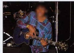
★FELICIA COLLINS/THOMSON TWINS/U. K.

★トップ=スプルース ★サイド&バック=オパール ★フィンガーボード=ローズウッド ★ブリッジ=ローズウッド ★ネック=マホガニー ★マシヘッド=タカミネオリジナル ★ピックアップ=PALATHETIC® ★コントロール=ゲインX1 トレブルX1 ベースX1 ★カラー=ストラトコールド(MG) エラクルブルー(MB)