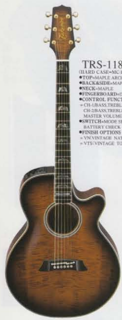
VN (VINTAGE TOBACCO SUNBURST)

TRE-108 ¥80,000 (HARD CASE-MIC SET ¥16,000) ●TOP-GRICE ●BACK&SIDE-MAHOGANY ●NECK-MAHOGANY ●FINGERBOARD-WOOD ●CONTROL FUNCTIONS =EQ.1-BASS, TREBLE, LEVEL EQ.2-BASS, TREBLE, LEVEL MASTER VOLUME ●SWITCH=MODE SELECT, OUT SELECT BATTERY CHECK ●FINISH OPTIONS =GBS (GRAY BLACK SUNBURST) =TRS (TOBACCO BROWN SUNBURST) =DRB (DARK BLUE SUNBURST)