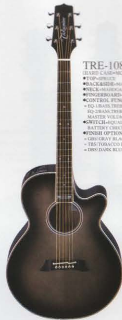
GBS (GRAY BLACK SUNBURST)

低音部の音質補正に使用するコントロール。使い易いセンタークリック式になっています。EQ.1、EQ.2の各プリアンプに対して個別に装備しています。