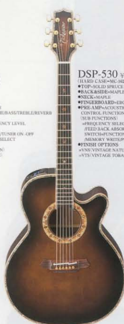
VNS(VINTAGE TOBACCO SUNBURST SATIN)

DSP-520 ¥200,000 (HARD CASE=MC-162 ¥16,000) ●TOP=SOLID SPRUCE ●BACK&SIDE=MAPLE ●NECK=MAPLE ●FINGERBOARD=EBONY ●PRE-AMP=ACOUSTIC DSP AD-1 CONTROL FUNCTIONS=VOLUME/BASS/TREBLE/REVERB (SUB FUNCTIONS) =FREQUENCY SELECT/FREQUENCY LEVEL /FEED BACK ABSORBER SWITCH=FUNCTION CHANGE/TUNER ON-OFF MEMORY WRITE/PROGRAM SELECT ●FINISH OPTIONS =VNS(VINTAGE NATURAL SATIN) =ANS(ANTIQUÉ NATMÉJ SATIN)