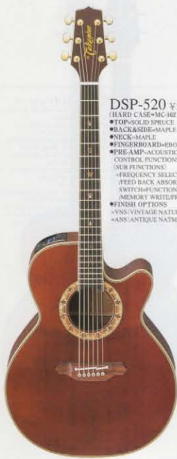
ANS(ANTIQUÉ NATMÉJ SATIN)

NPT-515 ¥150,000 (HARD CASE=MC-162 ¥16,000) ●TOP=SOLID SPRUCE ●BACK&SIDE=HAWAIIAN KOA WOOD ●NECK=MAHOGANY ●FINGERBOARD=EBONY ●CONTROL FUNCTIONS = VOLUME/TREBLE/BASS FREQUENCY LEVEL ●SWITCH=EQUALIZER PASS BATTERY CHECK ●FINISH OPTIONS = NS(NATURAL SATIN) = SB(SATIN BROWN SUNBURST)