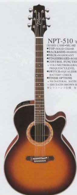
SBS(SATIN BROWN SUNBURST)

PT-508 ¥80,000 (HARD CASE=MC-162 ¥16,000) ●TOP=CEAR ●BACK&SIDE=MAHOGANY ●NECK=MAHOGANY ●FINGERBOARD=ROSEWOOD ●CONTROL FUNCTIONS = VOLUME/TREBLE/MIDDLE BASS/EXCITER ●SWITCH=BATTERY CHECK ●FINISH OPTIONS = VB(VINTAGE BROWN) = WR(WINE RED)