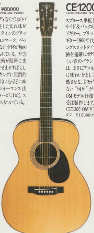
CE1200T ¥120,000 GUITAR ¥110,000 SPECIAL HARD CASE ¥10,000

オーディオリアムボディならではのバランス感、シャキッとした切れ味が特長。マーティンスタイルのブリッジ、白蝶貝ポジションマーク、ベームセルビックガードなど全体が極めてシンプルにまとめられている。丹念なクラフトマンの技術が随所に光り1200T、2000Tにせまるすばらしさ。フィンガーピッキングに圧倒的な威力を発揮し弾きこもほどに味わいをますコストパフォーマンス抜群のハンドメイドギターがにげど。スペシャルハードケースもついている。近日発売。