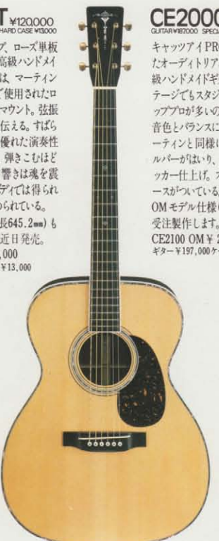
CE2000T ¥200,000 GUITAR ¥190,000 SPECIAL HARD CASE ¥10,000

スプルース単板トップ、ローズ単板サイド&バックの最高級ハンドメイドギター。ブリッジには、マーティンギター1960年代まで使用されたロングスロットタイプをマウント。弦振動を正確にボディに伝える。すばらしい音のバランス、優れた演奏性は、まさにプロ好み。弾きこもほどに味わいをまし深い響きは魂を震撼させる。Dモデルボディでは得られない“何か”が秘められている。OMモデル仕様(弦長645.2mm)も受注製作します。近日発売。CE1300 OM ¥130,000 ギター ¥117,000 ケース ¥13,000