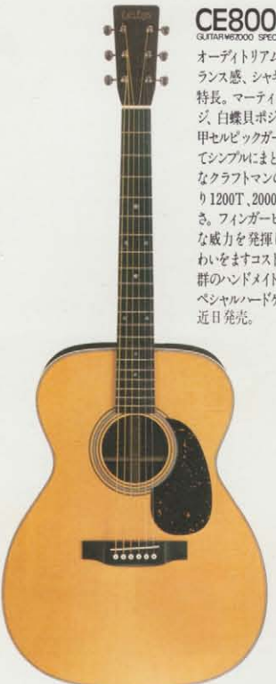
CE800T ¥80,000 GUITAR ¥70,000 SPECIAL HARD CASE ¥10,000

オーディオリアムボディならではのバランス感、シャキッとした切れ味が特長。マーティンスタイルのブリッジ、白蝶貝ポジションマーク、ベームセルビックガードなど全体が極めてシンプルにまとめられている。丹念なクラフトマンの技術が随所に光り1200T、2000Tにせまるすばらしさ。フィンガーピッキングに圧倒的な威力を発揮し弾きこもほどに味わいをますコストパフォーマンス抜群のハンドメイドギターがにげど。スペシャルハードケースもついている。近日発売。