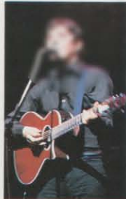
RICK DANKO (THE BAND)

TEA Deep Body & Shallow Body : TEAシリーズはこれまでのアコースティックギターと違い、ピックアップを内蔵したエレクトリックアコースティックギターです。ディープボディはアコースティックギター本来が持つ味わい深いサウンドを大切にしています。シャロウボディはリードプレイやモダンロックミュージックのカットアップに大きな効果を発揮します。ピックアップはトーンオリジナル、サウンドはすでに定評のもの。シングルカッタウェイ、16フレットジョイント、26フレットはギタープレイヤーに高度な演奏性を提供します。