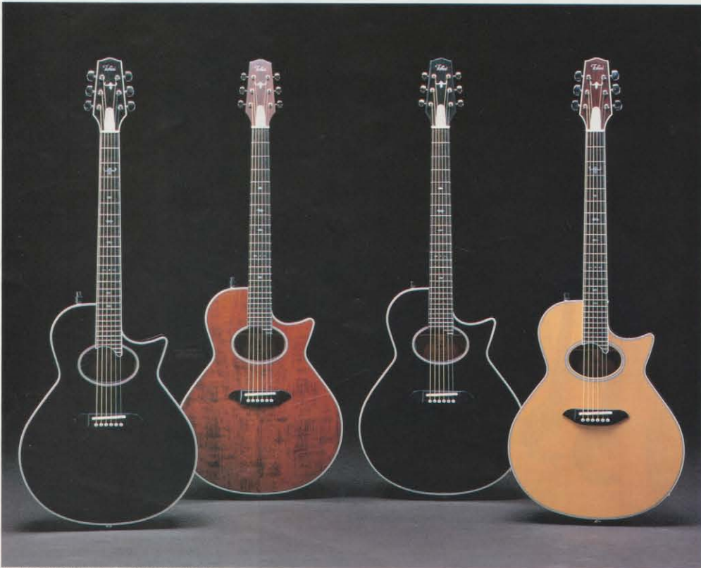
(左から) TEA80D-BB / TEA60D-AB / TEA60S-BB / TEA80S-L

TEA60D / ¥60,000 : アコースティックギターがもつ深い響きとヒューマンなニュアンスが大切にされたモデルです。コントロールは1ボリューム2トーンのデリケートな音割りを最重要視した設計。マホガニートーンを多様に表現します。 TEA80D / ¥80,000 : ローズウッドトーンをプロデュースするTEA80。シングルカッタウェイの技巧はトーン独自のものがあり、絶妙なバンド技術が美しいカーブラインをえがきます。オウヴァルサウンドホールはハウリング対策とサウンド追求から必然的に生まれたものであり、プロジェクトチーム独自のコンセプトもとんでいます。 TEA60S / ¥60,000 : リードプレイやロックミュージックのリズムカッティングなどに本領を発揮するシャロウボディのTEA。コントロールの1ボリューム1トーン設計はライブパフォーマンスを重視した結果です。トップにはスプルース単板、サイド&バックにはマホガニーが採用され独特のマホガニートーンをプロデュースします。 TEA80S / ¥80,000 : アメリカンブルグがインレイされたオリジナルデザインヘッドストック。単板スプルーストップ、ローズウッドサイド&バックが構成するボディコンストラクションのパーフェクトなパフォーマンスはエレクトリックアコースティックギターの基本。1ボリューム1トーンのコントロール設計がくりひろげる新しいサウンドワールドを体験してください。