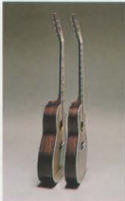
(左)ディープボディ(右)シャロウボディ