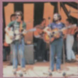
パシフィック・オーストラリア・オーデトリウム

TCM80T / VINTAGE 000-18 MODEL / ¥80,000: オーデトリウム2000 18をオール単板でハイブリッドしたモデルです。コンバート弾きやす いボディ、優れたバランスポイント、指板の滑らかな仕上げ、クラフト ウォークの響きの本質に再現されています。 TCM100T / VINTAGE 000-28 MODEL / ¥100,000: スキヤロッドとブレッシング。厳選されたマ テリアルから生まれるクリアなサウンドは連続性と指向性に優れ、ステージ でもスタジオでも高度なパフォーマンスを約束します。オーデトリウムの傑作です。 TCM250T / 1937 000-45 MODEL / ¥250,000: マーティンブライワー 000-45の設計思想を継承したハイブリッドモデルです。アバロンパー ルをふんばりに採用したまばゆいほどのインレイ、繊細な木材には最高傑作 の格調を示します。高度な音響性、最良のクラフトワーク、究極のヴァリエ テーション。[ギター ¥236,000 専用ケース ¥14,000] ●TCM-インテグレーションはす べて専用ケース付(別売)でお届けします。