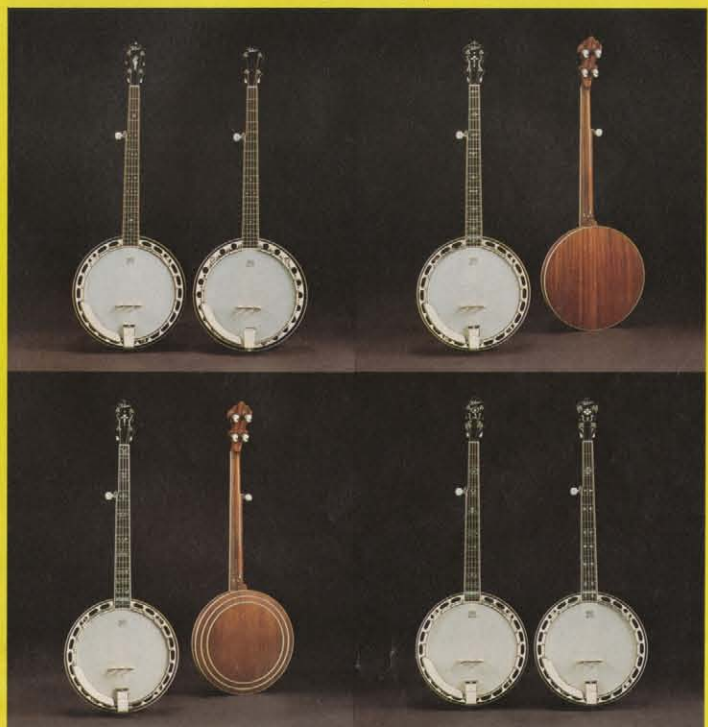
(左から)T-450R・T-450R・T-550R / (上)F・T-1200R・FE・T-1200R・W・T-1200R・HF