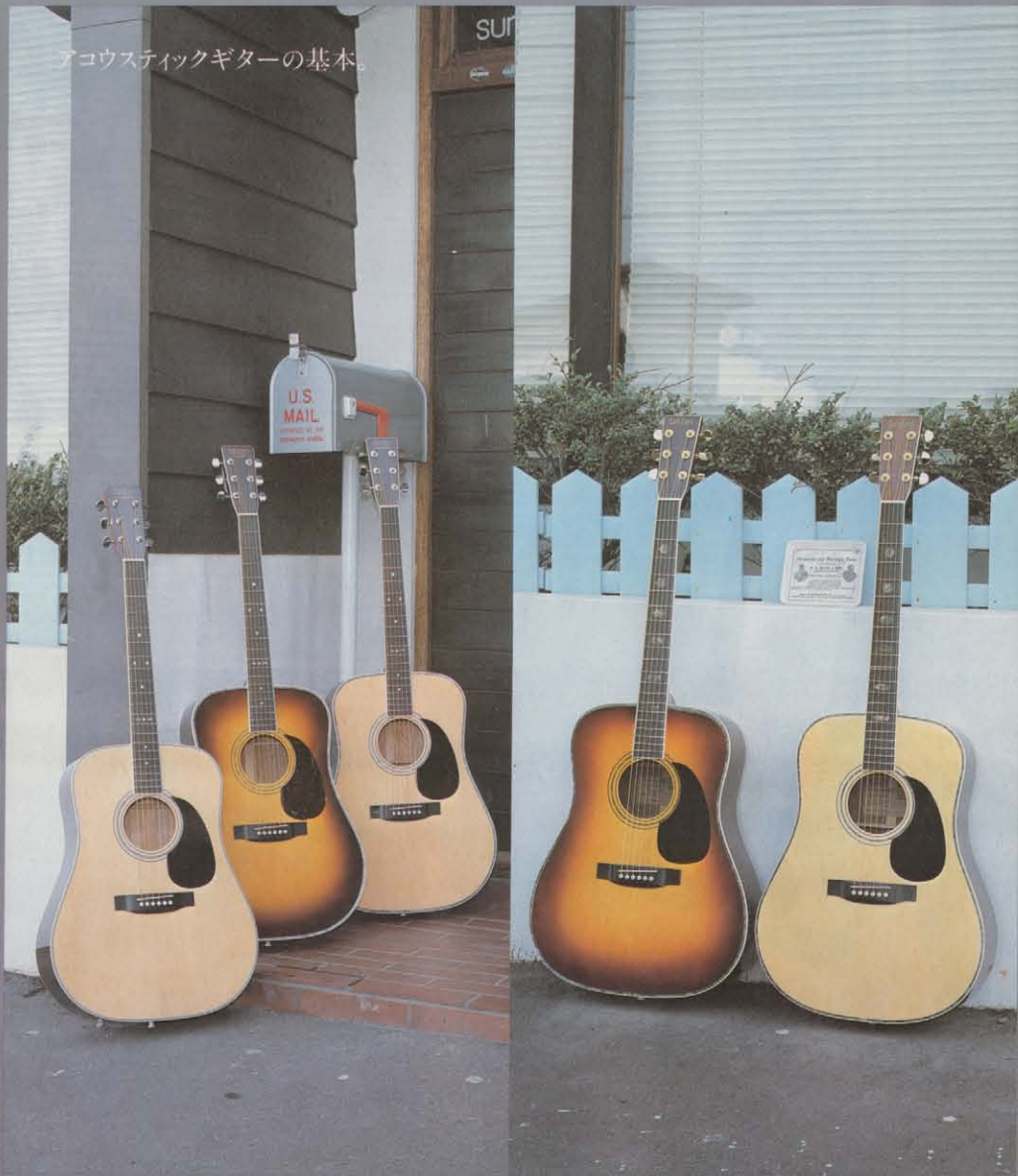
(左から)TCE20・TCE25・TCE25ST・TCE25・TCE30・TCE30・TCE35・TCE35ST・TCE35・TCE35ST・TCE35・TCE35ST