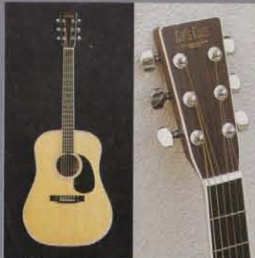
TCE35 (カシミアレッドウッドボディ、メイプルヘッドストック)

TCE20 / ¥30,000: 4弦アコースティックギターを継承するジブナンドレッドウッドボディから生まれた、最も人気のモデルです。 TCE25 / ¥25,000: フレイットブリッジを重視したギター設計は、ギターに最適です。スプルーストップとメイプルボディのボディからギターで、トランスのよきサウンドが生まれます。 TCE25ST / ¥25,000: CFコーン社のオプショナル仕様として人気の高いシェイプドトップを採用し、オールゲージ弦を弾かれています。サウンドは美しいワフル。 TCE30 / ¥30,000: スプルース単板トップ、オールマホガニーを継承した、スタチューヘッドストックとワンダーボードが生まれわたるキャッチアイを継承します。 TCE35 / ¥35,000: もっとも多くのプレイヤーに愛用されるカシミアレッドウッドボディのモデルです。深みのある低音。シリアスな高音はアコースティックギターの基本です。 TCE35ST / ¥35,000: フラットヘッドストックの音から味のある美しいサウンドが特徴のTCEです。個性的な美しいデザインとサウンドが魅力です。●TCE30・35・35STはスプルース単板トップのハイエンドパフォーマンスモデルです。