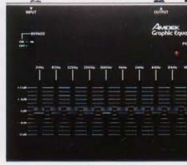
▲グラフィックイコライザー