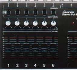
▲ステレオ6chミキサー

ミキサーは、複数の楽器やボーカルのレベルバランスを調整するには欠かせません。アムデックMXK-600は、マイクからライン入力まで広く使え、ハンズオフ付ステレオタイプのためスタジオ録音にも活躍。もちろん性能第一主義アムデックならではのローノイズ設計です。組立て工程数/30 ●コントロール/インプットレベル × 6、パンポット × 6、Ch. Vol × 6、マスター Vol × 2 ●出力/L ×