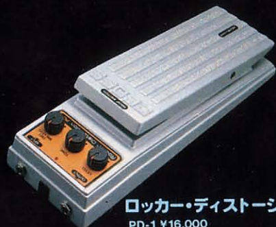
ロッカー・ディストーション PD-1 ¥16,000

●電源:DC3V、単2(2個)、ACアダプター ●消費電流:3V DC 40mA ●コントロール:ディストーション(ペダル)、ディストーション・ミニマム・レベル、トーン、レベル ●その他:ノーマル/エフェクト切替スイッチ、ワープ・スイッチ、エフェクト・インジケーター(バッテリー・チェック兼用) ●端子:入力、出力、ACアダプター ●入力インピーダンス:470kΩ ●出力負荷インピーダンス:10kΩ以上 ●外形寸法:110(W)×65(H)×320(D)mm ●重量:1.5kg ●付属品:キャリング・ケース