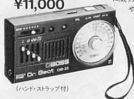
(ハンドストラップ付)