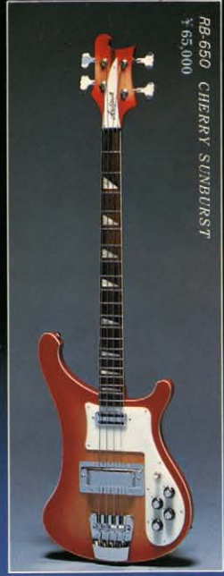
RB-650 CHERRY SUNBURST ¥65,000

リンデンボディ / メープル3ピースネック / 34 1 / 2 インチスケール / ローズフィンガーボード / ボディーつきぬきポールエンドコンピネーションブリッジ & テールピース / プロアルニコハムバッキングピックアップ / 3ポジションレバー / スイッチ / コントロールV×1、T×1、M×1 カラー - N-SB