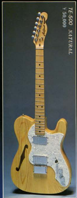
TE-500 NATURAL ¥50,000

ホワイトアッシュボディ / メープルワンピースネック / ローズフィンガーボード (ローズも有り) / テールピースブリッジ / プロアルニコハムバッキングピックアップ / 3ポジションレバー / スイッチ / コントロールV×1、T×1 カラー - N