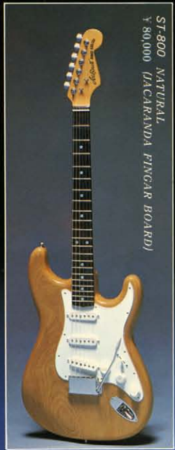
ST-800 NATURAL ¥80,000 (JACARANDA FINGER BOARD)

メープルボディ / メープルテッチャブルネック / メープルフィンガーボード / テールピースブリッジ / プロシングルコイルピックアップ / 3ポジションレバー / スイッチ / コントロールV×1、T×1 カラー - BL-B