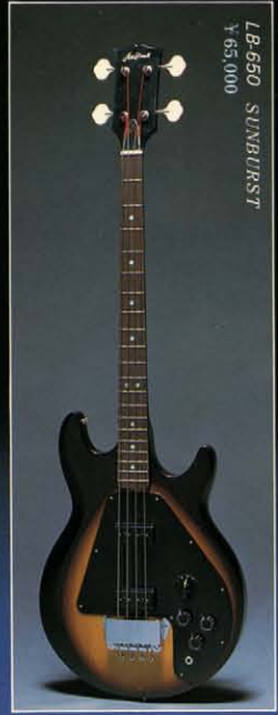
LB-650 SUNBURST ¥65,000

リンデンボディ / メープルテッチャブルネック / 34 1 / 2 インチスケール / ローズフィンガーボード / ボディーつきぬきポールエンドコンピネーションブリッジ & テールピース / プロアルニコハムバッキングピックアップ / 3ポジションレバー / スイッチ / コントロールV×1、T×2 カラー - S-BL-B