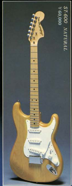
ST-600 NATURAL ¥60,000

ホワイトアッシュ単板ボディ / メープルワンピースオールドスタイル / ハカラシダはり指板 (メープルもあり) / シングルコイルPU「HOT STRATO」 / マシンヘッドシャーテム-6 Mini / ラッカー仕上げ カラー - N