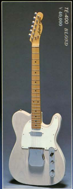
TE-400 BLOND ¥40,000

●カラー記号 N-NATURAL / BL-BLOND / B-BLACK / S-SUNBURST / CH-CHERRY SUNBURST