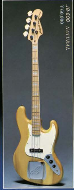
JB-600 NATURAL ¥60,000

メープルボディ / メープル・ローズ・メープル3ピースネック / ローズフィンガーボード / テールピースブリッジ / RB用プロシングルコイルピックアップ×2 / スイッチクラフト型スイッチ / ステレオジャック / モノジャック / コントロールV×2、T×2 カラー - N-CH-B