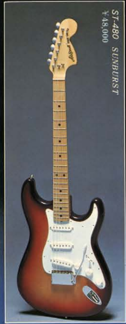
ST-480 SUNBURST ¥48,000

ホワイトアッシュ単板ボディ / メープルワンピーステッチャブルネック (ローズフィンガーボードも有り) / テールピースブリッジ / プロアルニコハムバッキングピックアップ / 3ポジションレバー / スイッチ / コントロールV×1、T×2 カラー - N-S-BL