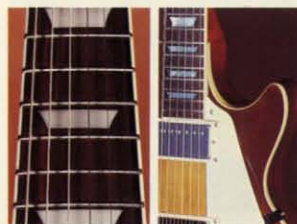
オーバーバインディングフレッキング セットネック

LS-600 は、トラモクのトップを使用し、さらに新開発EXTRA-I ハムバッカーをマウントしたニューモデルです。メロウでしなやかなオールドトーンとトラモクの映えるアンティークなフィニッシュが良くマッチした洗練されたモデルです。カラーはバイオリンフィニッシュ(VS)とチェリーサンバースト(CH)でいづれも個性的な仕上げ。プライスを完全にオーバーしたクオリティーが売物です。 ¥60,000