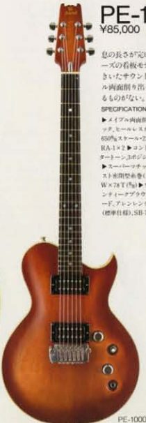
PE-1000 ¥85,000 ケース ¥15,000

息の長さが完成後の高さを出るPEシリーズの看板モデル。タイトにサステインのきいたサウンドを生み出すソリッドメイプル両面削り出しボディの美しさは比類するものがない。