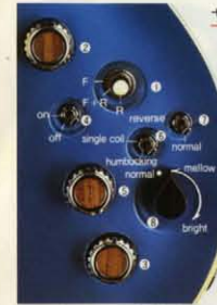
サーキット designed by Gerry Cott (PE-1000GC)

PE-1500-1000はカスタムタイプの専用ハードケースが標準仕様です。アクセサリーから楽器を守る最適仕様です。PE-800にはアークテクトタイプの専用ケースが標準仕様。