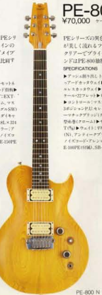
PE-800 ¥70,000 ケース ¥10,000

PEシリーズの黄色いグレインが美しく流れるファジシャブメナルクリアでブルーイットをハムバックンダサウンドはPE800独特のもの。