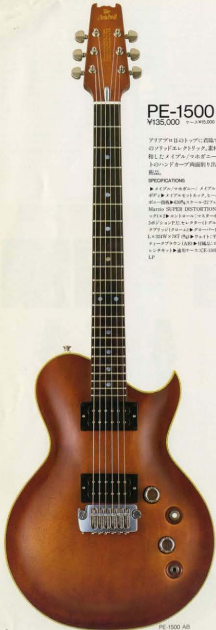
PE-1500 ¥135,000 ケース ¥15,000

アリアプロIIのトップに君臨する文字通り最高峰のゾリッドエレキリック。素材の長所が凡事に調和したメイプル/マホガニー/メイプル/ラミネートのハンドカーブ両面削り出しボディはまさに芸術品。