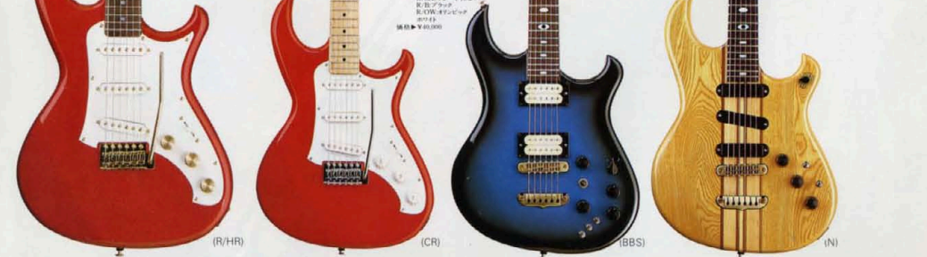
RSシリーズのボディカラーは15-16に、ヘッドは17-18に掲載されています。