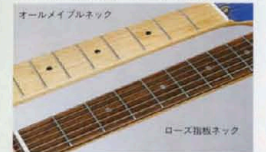
オールメイプルネック ローズ指板ネック

RS DELUXE-V・SPECIAL-Vにはメイプルシングルピース(ワンピース)のブレイクピースネックが採用された。キレ味のいいブロッカーサウンドキックアップはシングルコイルP.U.のシャープなトーンの威力を信増させる。ネックリッパリッド、リズムにオールマイティ。また、ボディへのジョイント部はスムーズに