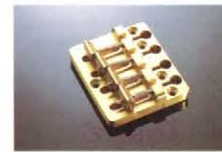
SOLID BRASS (NARROW PITCH) ¥10,000 SB-1000専用、ハイパフォーマンステイルピース。