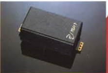
PI Max ¥30,000 ローノイズ、ハイアウトプットのスーパーハムバッカー。