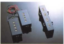
SPB-1 / SR-1 ¥7,000/¥6,500 ボールドビースタイプのハイパフォーマンスPU。