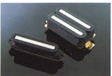
HOT BLADES / HOT BLADE-SC ¥10,000/¥8,000 極太バー採用によるハイアクトブPU。