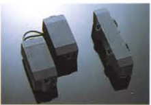
ALP-1 / ALJ-1 ¥15,000/¥15,000 アクティブローインピーダンスモデルPU。