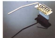
ACT-2 ¥5,000(Cr) ¥6,000(G) ¥65,000(K) 機能優先のシンプルメカニズムのレモロシステム。