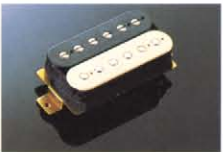
CLASSIC POWER ¥12,000(Cr) ¥13,000(G) スタンダードとも呼べる定番のハムバッカー。