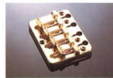
DIECAST (WIDE PITCH) ¥45,000(Cr) ¥6,000(G) ¥6,000(K) 弦振動を確実に安定に伝えるテイルピース。