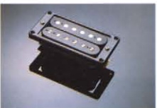
CLASSIC POWER IX ¥10,000 クアードでハンチのあるハムバッカー。