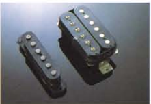
SSC-2B / SPF-1B ¥7,000/¥9,000 音質重視設計のSSHコンピネーションPU。