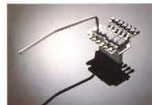
ACT-3 ¥22,000(Cr) ¥25,000(G) ¥26,000(K) ダブルロックシステムとファイナチューニングシステム。