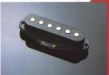
CPS-IX ¥8,000 音の立上りが鋭いシングルコイル。