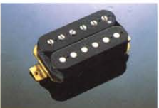
CLASSIC POWER II S ¥15,000 レスポンスを追求したCLASSIC POWER