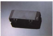
DIB-4J ¥12,000 JタイプのダブルコイルPU。