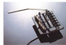
Kahler #2330 (MADE IN USA) ¥40,000 究極のトレモロユニットのスタンダードタイプ。