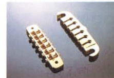
SUPER TUNABLE & QUICK HOOK ¥6,500 好みのモックアップが可能なハイグレードタイプ。