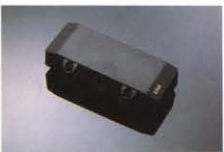
DIB-4P ¥12,000 Pタイプを完全モールドしたPU。