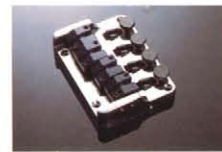
FB-11 ¥12,000 ベース用ファイナチューナー付テイルピース。