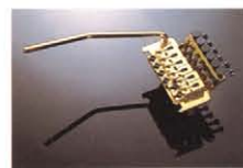
FLOYD ROSE (MADE IN GERMANY) ¥58,000 ファイナチューナー付きトレモロのスタンダード。