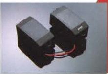
4AP ¥10,000 ハイインピーダンスのPタイプPU。