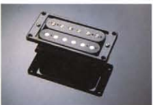
CLASSIC POWER VII ¥10,000 バランス重視設計のハムバッカー。