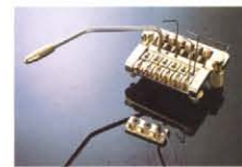
Kahler #2208 (MADE IN USA) ¥40,000 アーチトップ用最高階トレモロユニット。