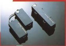
DISCANT APF-1 ¥65,000 3.0cmドコライナー内蔵のアクティブPU。