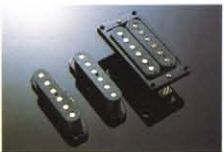
SS-1 / CLASSIC POWER-CST ¥15,000/¥20,000 最高のバランスを誇るハイグレードPU。