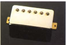
CLASSIC POWER II S ¥18,000 ウォームなトーンを追求したカブタイプPU。