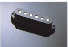
CPS-VII ¥8,000 スクアの良い高音が特長のシングルコイルPU。