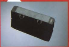
4AJ ¥10,000 ハイインピーダンスのJタイプPU。