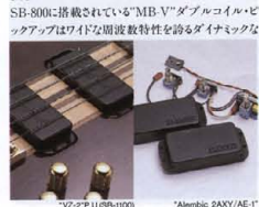
"VZ-2" P.U.(SB-1100) "Alembic 2AXY/AE-1" P.U.(SB-LTD)

大きさを同時に合せ持つ、オリジナル・アムブドール・キャクスターです。SB-950のP.U.は"VZ-1"、"VZ-2"と同じ構造ながら、24ダイナミズムを強調したサウンドです。SB-LTDには、独自の"Hi-Fi"思想により、ノイズを極限に抑えた透明感のあるブラインド・サウンドのALEMBICのアクティブ・ター・ハムバッキング2AXY/AE-1を搭載。ベース・サウンドに革命をもたらしたその音色は絶対的存在感でリスナーを直撃します。SB-800に搭載されている"MB-V"ダブルコイルピックアップはワイドな周波数特性を誇るダイナミックな