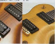
"OH-6" P.U.(PE-1100) "OH-2AL" P.U.(PE-800)