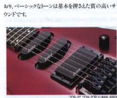
"CS-2" "CH-2" P.U.(MA-550)

MA-550には、フラットな音響特性で、アルダー材と最 高のマッチングを示す、「CS-2」シングルコイルと 「CH-2」ハムバッキングが選ばれました。ワイルドな ツアタキ・エッジ・トーンキヤクターは、シングルを選ば ないフレキシブルさが特徴です。MA-450には「CS- 1」シングルコイルと「CH-1」ハムバッキングの組合 せ、よりオープン・トーンキヤクターを持つ、カード ピッキングアップです。 MA-400には「OS-1」OH-1がセッティングされて