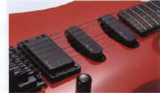
"OS-1" "OH-1" P.U.(MA-400)