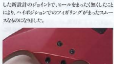
Super Heel-less Joint(MA-650)

「reflex」Pickup "reflex"はイギリスのハンドメイドピッキングアップで、 EMGに代表されるトップブレードアクティブP.U.の 一端を担う、ハイ・クオリティブランドです。リアンプを 通じて出力されるサウンドは、クリアと表現し易い。