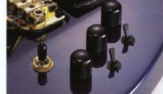
Hyper Active Control(MA-750)

オフ周波数付近にレゾナンス(共振)を起こし、その ピークの度合を、Qスイッチでノーマルとブライの2タ イプ選択できます(図1)。そしてカットオフ周波数を移 動させることで(図2)、圧倒的な音色変化を可能とする サークットです。特にブライポジションでは、過激なま での変化を示し、そのアタック・トランジェントは、ギタ ー本体のみで、はるかに要求するサウンドをクリエイトする プロフェッショナルシステムです。