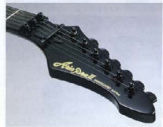
14" Pitched Head(VA-550)

このクラスとしては数少ないスケールも言える14" ピッチヘッドを採用しました。各弦に適正なテンションを与え、抜群のプレイフィールングを約束します。ロックナット使用モデルにも理想的なロック・テンションを確保、チューニングをサポートします。 VABには14" ピッチヘッドを採用。強めのテンションが弦開きの首音を鮮やかにリリース、芯のある低音域をプロデュースします。