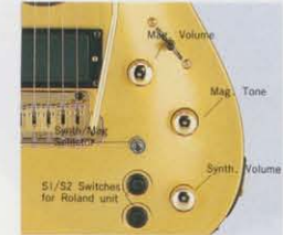
MAC-MID-DV専用弦 Aria US-800L/XL