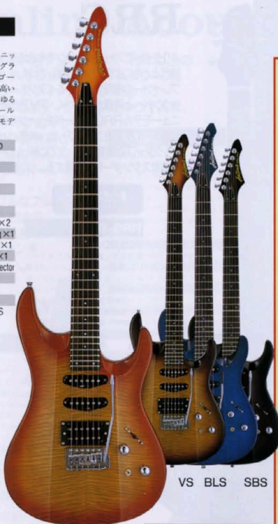
VS BLS SBS