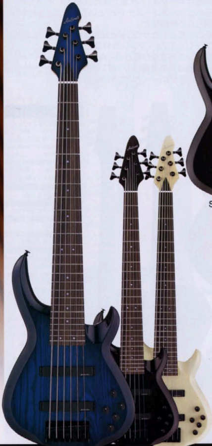
BLS SB SBZ

スーパーベジスト、スティーブ・ベイルーとのコラボレーションによるAPブランドのAVB-SSBモデルをトップに、幅広いバリエーションで圧倒的な人気を誇るアバンテシリーズ。97年モデルはさらに改良を加えた、アバンテマークIIが新登場。徹底的に細部までこだわってリファインされたボディシェイプは、サウンドクオリティと演奏性を高めるだけでなく、ビジュアル的にも最高にエキサイティングなスタイルへと変化した。