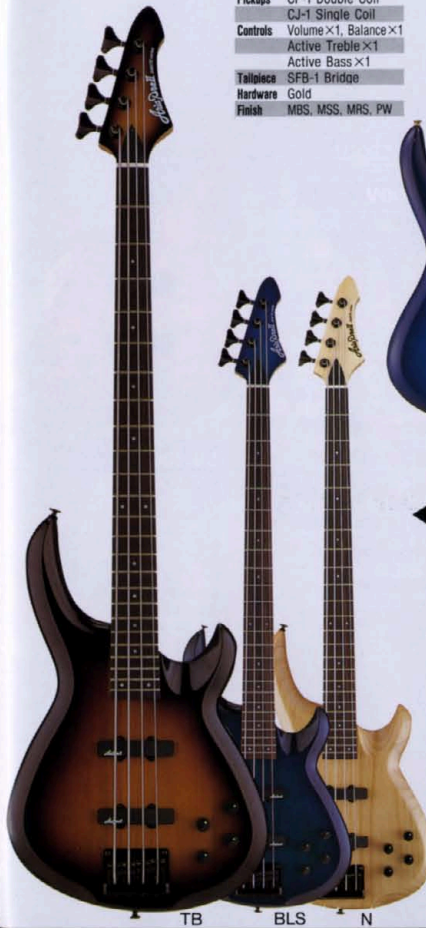
TB BLS N