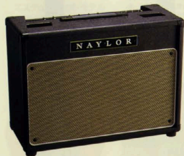
SC38のコンパクトタイプ、30センチスピーカーを1基搭載。 SUPER-CLUB 38-112 ¥280,000 (SC38-112) TUBE GUITAR COMBO AMPLIFIER