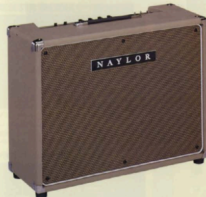
SC38にアキエトロニクス社製リバーブユニットを組み込んだモデル。 ELECTRA-VERB-38-212 ¥380,000 (EV38) TUBE GUITAR COMBO AMPLIFIER WITH REVERB