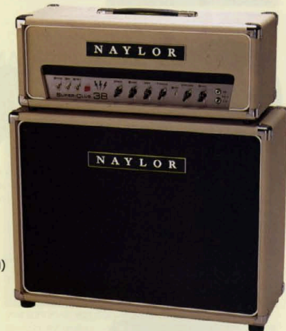
出力60W (RMS)のアンプヘッド、充分な音量と太くスムーズなサウンド。 SUPER-DRIVE SIXTY (SD60) ¥280,000 TUBE GUITAR AMP HEAD