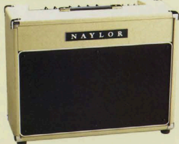
SD60のコンパクトタイプ、30センチスピーカーを2基搭載。 SUPER-DRIVE SIXTY-212 ¥320,000 (SD60-212) TUBE GUITAR COMBO AMPLIFIER