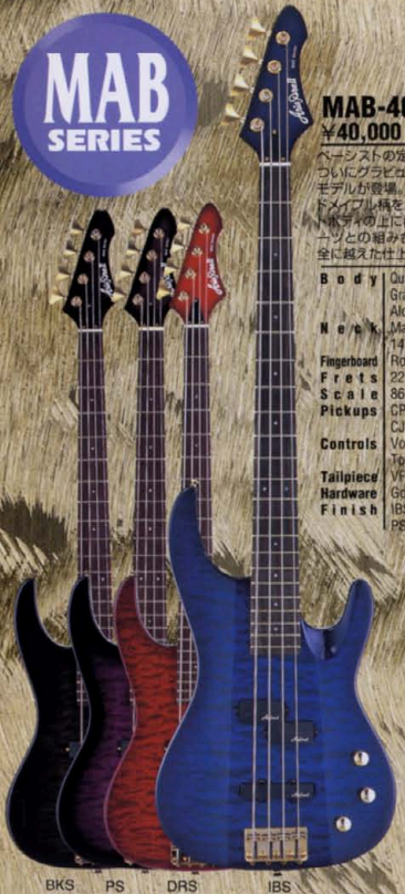
BKS PS DRS IBS