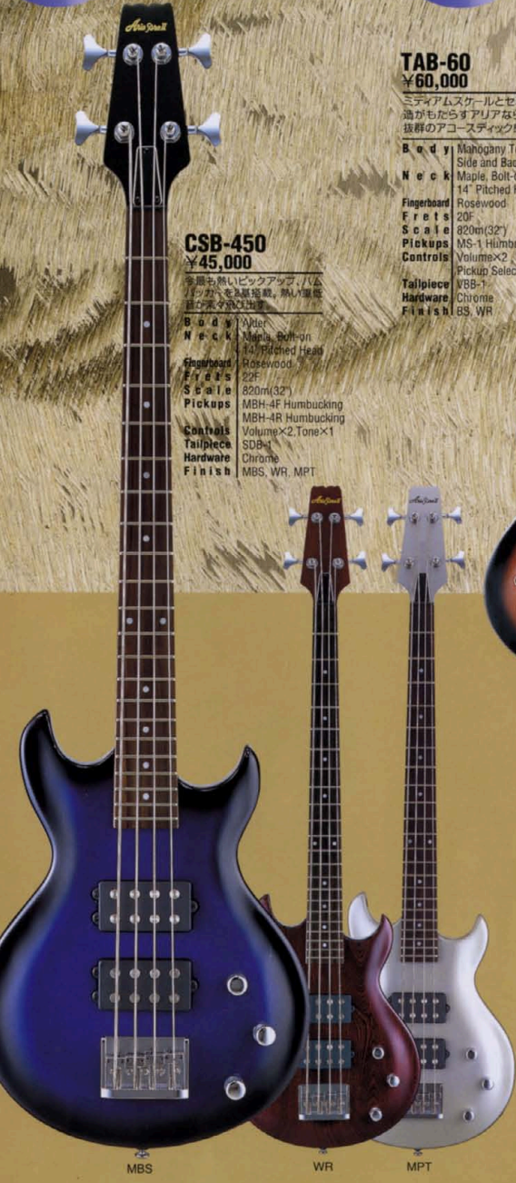
MBS WR MPT