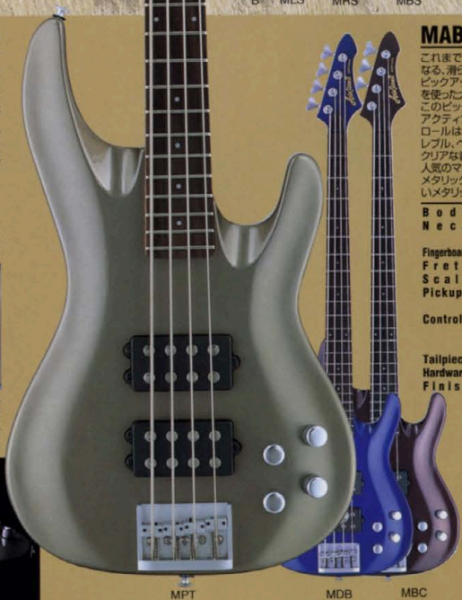
MPT MDB MBC

バンドの根底をしっかりと支えるクレバーさが求められるベーシストへの登竜門として、MABは確実にプレイヤーのハートを捉えている。それは、飽きの来ないオーソドックスさと、時代を反映するモダンさを兼ね備えたオリジナルボディとオールマイティなサウンドが、MABを弾きこなすプレイヤーを、いわゆる縁の下力持ちではなく、よりバンド全体を引っ張っていくアグレッシブなベーシストへと変身させるからに違いない。