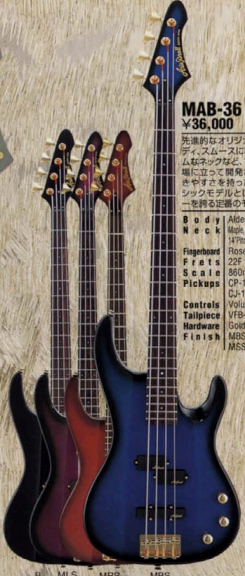
B MRS MSS