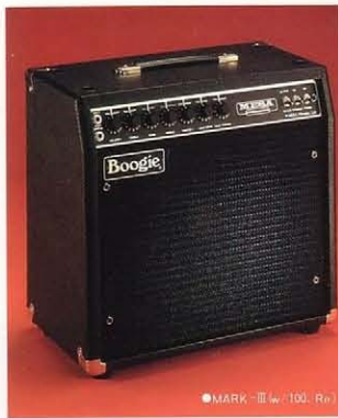
●MARK-III (w/100, Re)