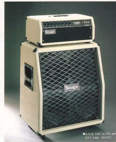
●S.O.B. TOP (w/100, WP) EXT. CAB. (4X12")