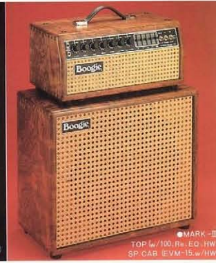
●MARK-III TOP (w/100, Re, EQ, HW) SP. CAB. (EVM-15" w/HW)