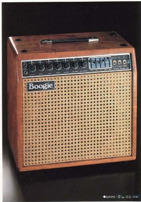
●MARK-III (w/EO, HW)

メサ・ブギーの歴史と共に歩み続けているMARKシリーズは、現在のブギーアンプのラインナップのすべての基本となっているものです。この小型キャビネットの中には、メサ・ブギーのノウハウが多くの特許(特許)と共に盛り込まれ、ベーシックモデルでも60W (RMS)アンプとは思えないほどのクオリティーの高いハイ・パワーサウンドが得られます。チューブシステム(管球式)独自の暖かみがあるクリアトーンから自然なオーバードライブディストーションまで、ユニークなカスケードチューブテクノロジーを採用することにより、微妙なサウンドのコントロールを可能としました。さらに、トライモードプリアンプシステムは、プリセットされたリードとリズムの各モードを、フォトカプラSWにより、ノイズもなく切り換えられます。そしてリズムモードは1と2をセレクトできます。ブライトでクリーンなウエストコーストサウンドのリズム1と、歯切れのよいプリティッシュサウンドが得られるリズム2。さらにブギー独自のオーバードライブブリードトーンが加わり、ますますサウンドバリエーションを豊富にしました。また、コントロールノブでのプルスウィッチングによる5つのボイスコントロールでの音創りも豊富です。リアパネルに配したプレゼンスコントロールやエフェクトのセンターリターン端子、ダイレクトアウトとそのレベルコントロール等すべてが世界のトップギタリストが絶賛する要因となっています。MARKシリーズには12"スピーカービルトイン型のほかに15"ビルトイン型、アンプトップのみ等オプションと共に豊富なバリエーションが用意されています。