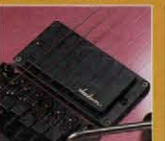
ハイアウトプットタイプ。バラス

シャペルでは、1H、H2SCのPUスタイルでコンビネーションされる。J-90Cは、バスウッドボディ、ジャクソンPUの中で特に、バスウッドボディを意識したワイヤリングされた、ウル