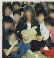
●人気ギタリスト、ジョージ・リンチも年に数回来校し、楽器について指導。

オール・ハンドメイドによる工法をベースにしながらも、卒業後の就職に直結する機械による工法、さらにはコンピューター制御木エルーター（NCルーター）を使用する工法に