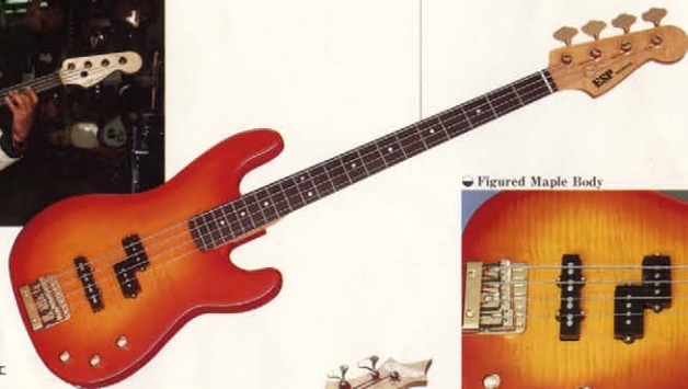
Figured Maple Body