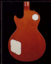
バックには、軽量のホンジュラス産のマホガニーを使用することによって、音のヌケ、つやが明らかに違うものになる。