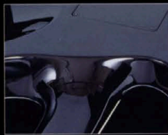
素晴らしいサスティーン、プレイヤビリティは、スルーネック構造の最大のメリットである。