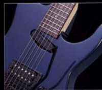
シンプルなS-H-P.U.レイアウトながら、バリエーションに富んだサウンドが特徴である。