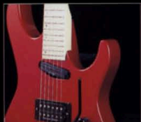
ミディアムスケールとディープカットにより、ハイポジションでの抜群のプレイヤビリティを実現

BODY : Alder or Ash NECK : Maple / Rosewood, 24Frets, Bolt on SCALE LENGTH : 25 1/2" PICKUPS : ESP MOTHER-II(B), POWERRAIL(N) BRIDGE : Floyd Rose System CONTROL : 1 Volume PRICE : 200,000 yen