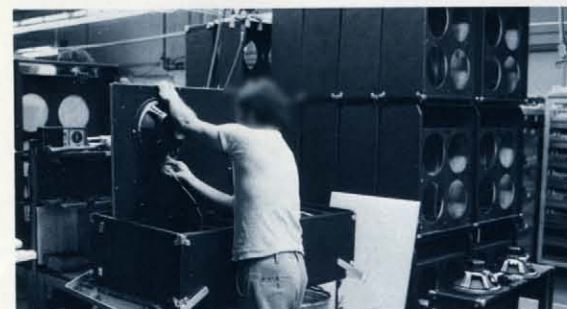
スツケースピアノ アンプスピーカー部組み立て作業 スピーカーをパツル板に取り付け、スピーカー配線をしているところです。後に見えるアンプキャビネットはベースマン10