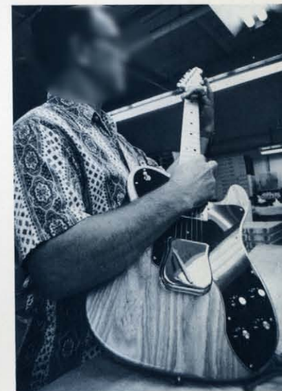
ギター検品作業(テレキャスターカスタム ナチュラルメイプルネック) この様に1本1本細部にいたるまでチェックされ、合格したものののみ出荷されます。