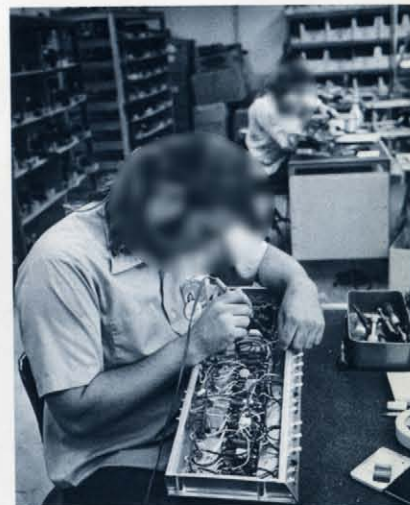
アンプ組み立て作業 ラグ板にハンダ付けされたパーツと各コントロール、チューブソケット等の配線をしているところです。