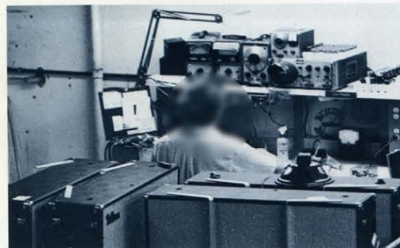
アンプ電気系統チェック 多くのチェック項目のすべてに合格したアンプは検品者がサインしパッケージされます。

下の写真はフェンダー工場に於けるアンプ・ギターの製作過程です。ボディ・ネックはもとよりブリッジからピックアップ等ほとんどのパーツがこの工場で作られ1台の楽器として組み立てられるのです。組み立てられたギターは何度もチェックされ、楽器として完成します。こうして完成されたギターが海を渡り世界各国のミュージシャンに愛用されています。