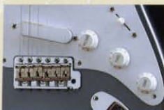
Eric Clapton Model

エリック・クラプトン・モデルはサテンフィニッシュの“V”シェイプネック、ボディに3個のゴールド・レースセンサーをマウントし、アクティブ・サーキットを内蔵。これによりコントロールは1 volume、1 TBX、1 mid-boostとなり、クラシカルなフェンダーサウンドからミッドレンジ・ハムバックングトーンまで幅広い音作りが可能となった。