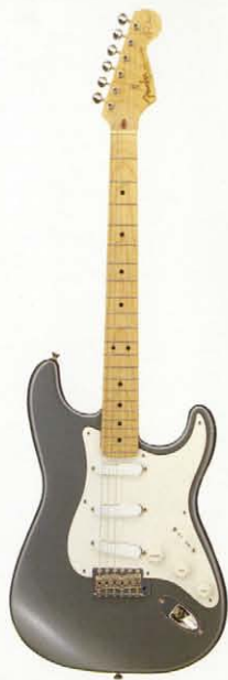
Eric Clapton Model Stratocaster (Tremolo Locked)