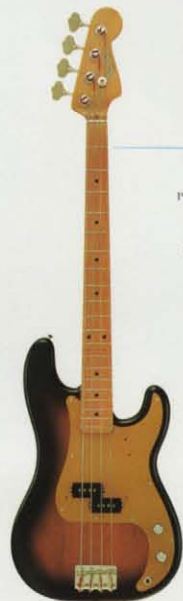
PB'57-95 ¥95,000 Body=ソリッド・アルダー・コンタクトボディ Neck=1ピース・メイプル・メイプルネック Fretboard=メイプル指板 Pickup=ワインテッジ・スプリットPU (U.S.A.) Pickguard=アルミ焼付 (U.S.A.) Controls=1ボリューム、1トーン (U.S.A.) Finish=ラッカー仕上げ Color=T・BLK/VWH/CAR/FRD