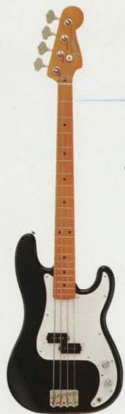
PB'57-70 ¥70,000 Body=ソリッド・アルダー・コンタクトボディ Neck=1ピース・メイプル・メイプルネック Fretboard=メイプル指板 Pickup=ワインテッジ・スプリットPU Pickguard=1ピース・オフホワイト Controls=1ボリューム、1トーン Finish=ポリエスチル仕上げ Color=T・BLK/VWH/CAR/FRD