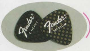
●CARBON PIC (MEDIUM, EXTRA HEAVY) ¥200

1 951年、最初のELECTRIC BASSはニュー ヨーク48丁目のマニース楽器店に現れた。ミュージ シャンユニオンの登録係は早速そのエレキベースの ために職種欄に新しいカテゴリーを命名したが、 「ELECTRIC BASS」ではなく「FENDER BASS」 とした。ウッドベースしか知らない連中にとって、このア ピアランスはあまりに強烈だったのだ。音楽事情を刺 激するFENDER BASS。