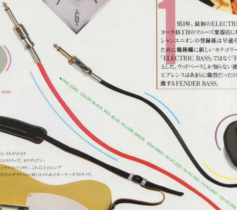
●PRO CORD COLOR: BLACK, RED, BLUE, YELLOW, GREEN 60cm ¥800・3m ¥1,200・5m ¥1,500・7m ¥1,800・10m ¥2,200