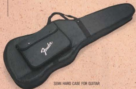
SEMI HARD CASE FOR GUITAR

TWEED CASE FOR GUITAR ¥33,000 TWEED CASE FOR BASS ¥36,000 HARD CASE FOR GUITAR ¥17,000 HARD CASE FOR JG, JM, ST-XI ¥17,000 HARD CASE FOR BASS ¥19,000 SEMI HARD CASE FOR GUITAR ¥12,000