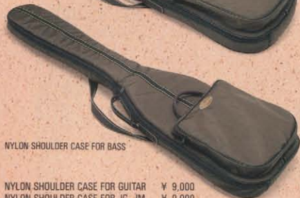
NYLON SHOULDER CASE FOR BASS

NYLON SHOULDER CASE FOR GUITAR ¥ 9,000 NYLON SHOULDER CASE FOR JG, JM ¥ 9,000 NYLON SHOULDER CASE FOR BASS ¥10,000 NYLON SHOULDER CASE FOR 406BASS ¥10,000