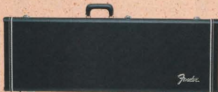
HARD CASE FOR GUITAR

TWEED CASE FOR GUITAR ¥33,000 TWEED CASE FOR BASS ¥36,000 HARD CASE FOR GUITAR ¥17,000 HARD CASE FOR JG, JM, ST-XI ¥17,000 HARD CASE FOR BASS ¥19,000 SEMI HARD CASE FOR GUITAR ¥12,000