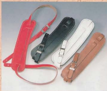
VINTAGE STRAP ¥3,800 COLOR = BLACK, TAN, RED, WHITE

本皮に似せた質感が全盛の今日、ビグスギンを侮ったウンテンジーンストラップを使うほどに味が出ます。肩にしっかりとくくりなじんでくれます。クリート等でのお手入れも忘れず。