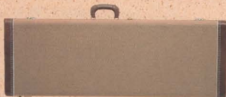
TWEED CASE FOR GUITAR

NYLON SHOULDER CASE FOR GUITAR ¥ 9,000 NYLON SHOULDER CASE FOR JG, JM ¥ 9,000 NYLON SHOULDER CASE FOR BASS ¥10,000 NYLON SHOULDER CASE FOR 406BASS ¥10,000