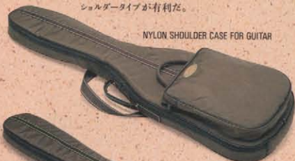
NYLON SHOULDER CASE FOR GUITAR

持っている道具がその人のグッドテイストを語るなら、その道具をどこに、どう取めているかにも注目したい。ケースの話なんだけど、フエnderケースの形状、素材の多彩さはギター本体に負けず劣らず豊富。ベーシックでヘヴィデューティなのがハードタイプ、サイドを使ったものと塩ビとがあるが、機材と一緒にロードに出る人はこのタイプに限る。スタジオやちょっとしたギグなどにはセミハード、ショルダータイプが有利だ。