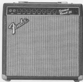
SIDEKICK 35R ¥38,800