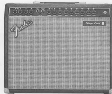
STAGE LEAD 1-12 ¥95,000