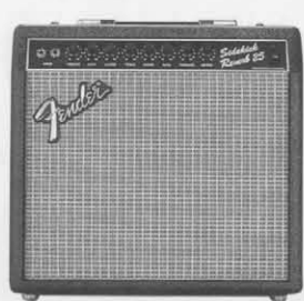
SIDEKICK 25R ¥33,800