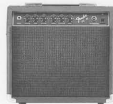
STUDIO LEAD 15 ¥13,200

フンダーズピロツを雄弁に語りつつ、傑出したサウンドメイクを生成する2チャンネルインプットシステム、ステージリードII。創造力を触発する3バンドのシブEQ装備のAチャンネル、4バンドアクティブEQ装備のBチャンネル。世界のトッププロに支持され、魅了するUSAアキュトロクス社製リールテープを装備。1-12は30センチ1本、2-12は30センチ2本をマウントしてステージングにより選択できる完全プロ仕様アンプです。スタジオリード15はワンランク上のサウンド強化を図る新設計の3ボリュームコントロール、トレブル、ベースのトーンコントロール、ミッドレンジのコントア(周波数可変フィルター)を加えた新設計の3トーンシステムをセット。意のままに操れる優れた操作性により、これまでにないバリエーション豊かなトーンキャラクターを妥協なくワイドにクリエイト。