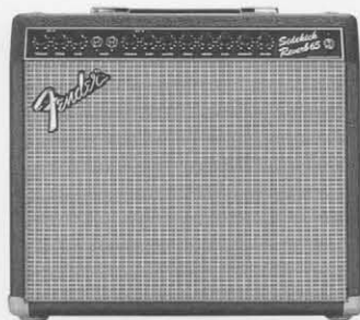
SIDEKICK 65R ¥65,000