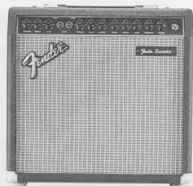
SIDEKICK SWITCHER ¥48,000

時代をのみこんだメカニズムと完全なフンダーサウンドを放つサイドキック・ギターアンプ。SK65RはステージリードIIIにも採用されているハイポテンシャルな2チャンネルインプットシステムを導入し、充実した機能と群を抜く性能がスタジオ、ライブを完全フォロー。リアリティあふれるパフォーマンスを約束します。またSK50RはA、Bそれぞれのチャンネルにセットした異なるディストーションキャラクターをフットコントロール操作。AからBへ、BからAへアンサンブルに合わせてサウンドチェンジが可能です。SK65R譲りのポテンシャル、2チャンネルアンプの機能をコンパクトなサイズに納めてしまったSKスイッチャー。AチャンネルとBチャンネルを単独で、A+Bのチャンネルミックスなどでフルに使える充実した機能を装備。ハイクラスモデルの優れたサウンドキャラクターをそのままスケールダウンしたSK35R、SK25Rなどラインアップも多彩。