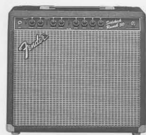
SIDEKICK 50R ¥55,000