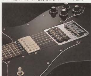
TCM MODEL CONTROLS ミディアムスケールにシムバックスを搭載したカスタムモデル。スレードなサウンドと多彩なトーンを持つ。