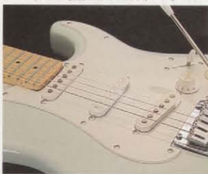
DiMarzio HS-3 STACK TYPE PICKUPS STM750DMにはハイパワーでのプレイに適したローノイズでセンシティブなディマジオHS-3をマウント。