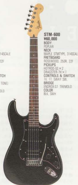
STM-600 ¥60,000 BODY POPLAR NECK MAPLE STMTYPE, 314SCALE FRETBOARD ROSEWOOD, 250R, 22F PICKUPS HOTROD-SS x 2 DRAGSTER-7H x 1 CONTROLS & SWITCH TV, 1T, SWAY SW BRIDGE ENDROX-G1 TREMOLO COLOR BLK, SWH