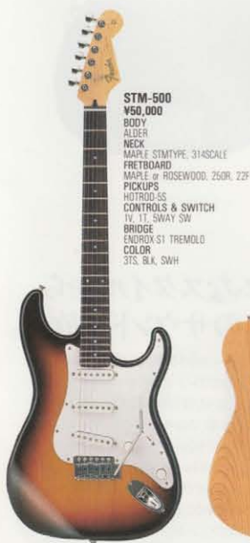
STM-500 ¥50,000 BODY ALDER NECK MAPLE STMTYPE, 314SCALE FRETBOARD MAPLE or ROSEWOOD, 250R, 22F PICKUPS HOTROD-SS CONTROLS & SWITCH TV, 1T, SWAY SW BRIDGE ENDROX-S1 TREMOLO COLOR BLK, SWH