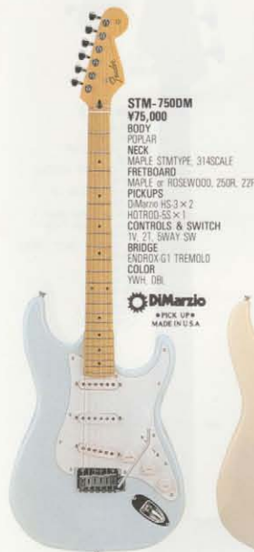
STM-750DM ¥75,000 BODY POPLAR NECK MAPLE STMTYPE, 314SCALE FRETBOARD MAPLE or ROSEWOOD, 250R, 22F PICKUPS DiMarzio HS-3 x 2 HOTROD-SS x 1 CONTROLS & SWITCH TV, 2T, SWAY SW BRIDGE ENDROX-G1 TREMOLO COLOR VWH, DR DiMarzio ATK UP MADE IN U.S.A.