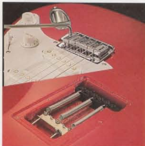
ENDROX-G1 10.5mm PITCH TREMOLO UNIT シンプルなスタイルと機構をナフエッジ2点支持タイプとしたエンドロック装備の10.5mmピッチトレモロ。