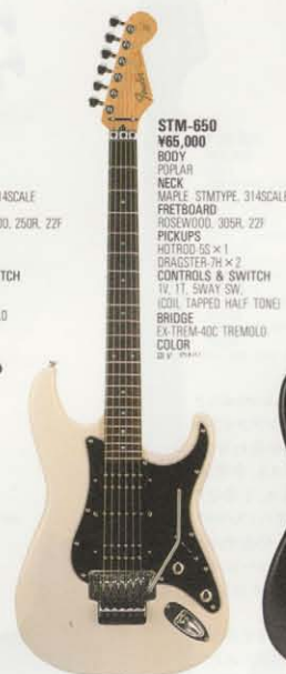
STM-650 ¥65,000 BODY POPLAR NECK MAPLE STMTYPE, 314SCALE FRETBOARD ROSEWOOD, 305R, 22F PICKUPS HOTROD-SS x 1 DRAGSTER-7H x 2 CONTROLS & SWITCH TV, 1T, SWAY SW, (COIL, TAPPED HALF TONE) BRIDGE EX-TREM-40C TREMOLO COLOR DR, SWH