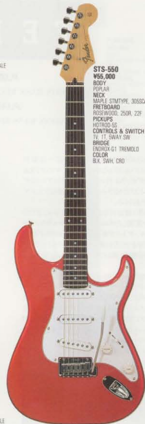
STS-550 ¥55,000 BODY POPLAR NECK MAPLE STMTYPE, 305SCALE FRETBOARD ROSEWOOD, 250R, 22F PICKUPS HOTROD-SS CONTROLS & SWITCH TV, 1T, SWAY SW BRIDGE ENDROX-G1 TREMOLO COLOR BLK, SWH, CRD