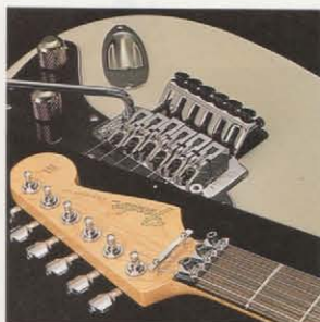
EX-TREM-40C TREMOLO UNIT STMの演奏性EX-TREMの機動性を最大限に生かす40mm幅のナットロックを持たせたニューバージョン。