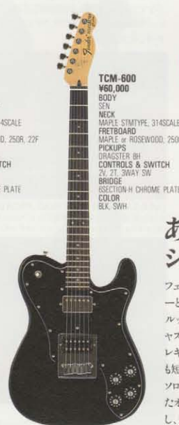
TCM-600 ¥60,000 BODY SEN NECK MAPLE STMTYPE, 314SCALE FRETBOARD MAPLE or ROSEWOOD, 250R, 22F PICKUPS DRAGSTER BH CONTROLS & SWITCH 2V, 2T, SWAY SW BRIDGE SECTION-H CHROME PLATE COLOR BLK, SWH