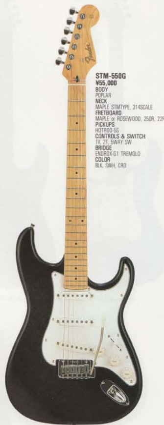
STM-550G ¥55,000 BODY POPLAR NECK MAPLE STMTYPE, 314SCALE FRETBOARD MAPLE or ROSEWOOD, 250R, 22F PICKUPS HOTROD-SS CONTROLS & SWITCH TV, 2T, SWAY SW BRIDGE ENDROX-G1 TREMOLO COLOR BLK, SWH, CRD