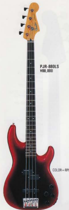
COLOR = RPB