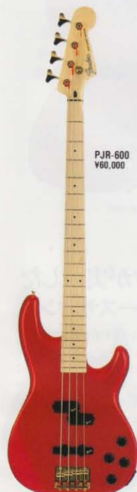
COLOR = CRD/M

PJR-600 ¥60,000 BODY INDONESIAN CAMP NECK MAPLE PJRTYPE, 432SCALE FRETBOARD ROSEWOOD, 250R, 22F PICKUPS DRAGSTER-7P x 1 HOTROD-7JR x 1 CONTROLS IV, 1BALANCE, 1BASS, 1TREBLE BRIDGE BRASS HEAVY-DUTY COLOR BLK, CWH, CRD