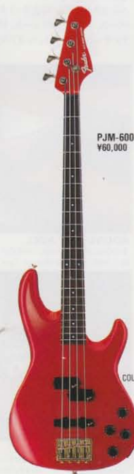
COLOR = CRD/R