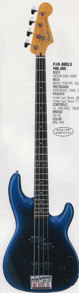
COLOR = BFB

ブースト&カットのトレブルとベースコントロールが透明感ある高音域、タイトに締まった低音域を演出する。