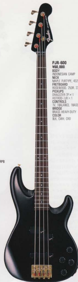
COLOR = BLK/R

PJR-600 ¥60,000 BODY INDONESIAN CAMP NECK MAPLE PJRTYPE, 432SCALE FRETBOARD ROSEWOOD, 250R, 22F PICKUPS DRAGSTER-7P x 1 HOTROD-7JR x 1 CONTROLS IV, 1BALANCE, 1BASS, 1TREBLE BRIDGE BRASS HEAVY-DUTY COLOR BLK, CWH, CRD