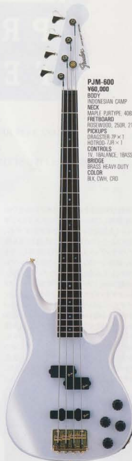
COLOR = CWH/R

PJM-600 ¥60,000 BODY INDONESIAN CAMP NECK MAPLE PJRTYPE, 406SCALE FRETBOARD ROSEWOOD, 250R, 21F PICKUPS DRAGSTER-7P x 1 HOTROD-7JR x 1 CONTROLS IV, 1BALANCE, 1BASS, 1TREBLE BRIDGE BRASS HEAVY-DUTY COLOR BLK, CWH, CRD