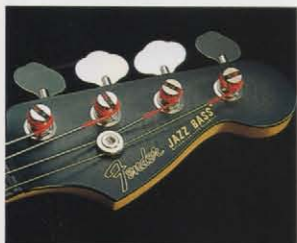
GRAPHITE REINFORCED NECK ネックとフレットボードの間にグラファイトプレートをはさみ込んだグラファイト強化ネックをセットしたニュースタイルのモデル。

強化スチールバーをインサートしたタイプを採用し、強大なベース弦のバイブレーションによるネックの振動を最小限にとどめ、クリアに抜け出る未体験のワイドレンジなサウンドを放出。 ●ダイナミックなサウンドクオリティを追求したニューキャラクターを持つピックアップHOTROD-7JRとして新開発の5弦用ピックアップ75JF、75JRは専用のエレクトロニクスサーキットシステムアップしてハッシュタイプの高強さと、アクティブタイプの繊細さを合わせ持つハイブリッドタイプ。鋭いレスポンスと、全音域にわたってフラットなトーンクオリティ、十分なアウトプットレベル、L-o-Bまでもクリアに、そして重厚に再現するワイドな周波数特性など優れたスペックを達成。コントロールシステムはブースト&カットタイプのトレブルとベース、マスターボリューム、そしてピックアップパラランサーをストレートにレイアウト。