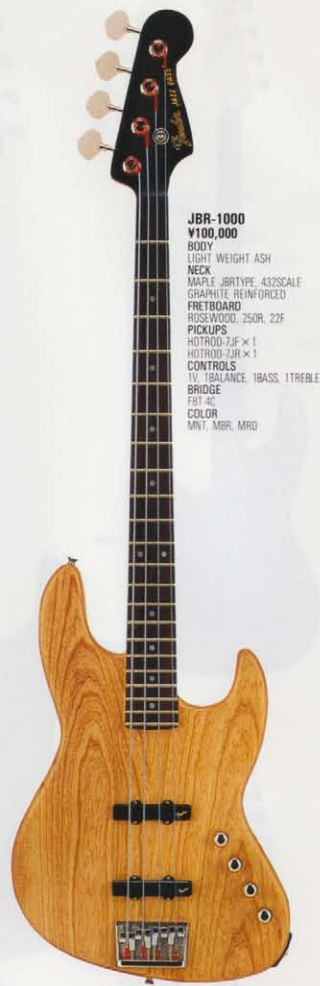
JBR-1000 ¥100,000 BODY LIGHT WEIGHT ASH NECK MAPLE, JBR TYPE, 432SCALE GRAPHITE REINFORCED FRETBOARD ROSEWOOD, 250R, 22F PICKUPS HOTROD-7JF × 1 HOTROD-7JR × 1 CONTROLS TV, BALANCE, IBASS, ITREBLE BRIDGE GBT-5C COLOR MNT, MBR, MRD