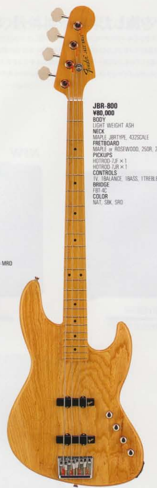
JBR-800 ¥80,000 BODY LIGHT WEIGHT ASH NECK MAPLE, JBR TYPE, 432SCALE FRETBOARD MAPLE or ROSEWOOD, 250R, 22F PICKUPS HOTROD-7JF × 1 HOTROD-7JR × 1 CONTROLS TV, BALANCE, IBASS, ITREBLE BRIDGE GBT-5C COLOR NAT, SBK, SRD