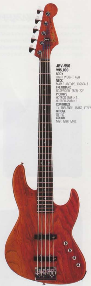
JBV-950 ¥95,000 BODY LIGHT WEIGHT ASH NECK MAPLE, JBR TYPE, 432SCALE FRETBOARD ROSEWOOD, 250R, 22F PICKUPS HOTROD-7JF × 1 HOTROD-7JR × 1 CONTROLS TV, BALANCE, IBASS, ITREBLE BRIDGE GBT-5C COLOR MNT, MBR, MRD