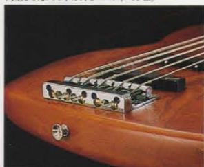
GBT-5C BRIDGE スピードな弦交換が可能なクイックフックホールを装備した新開発の5弦用オリジナルブリッジ。