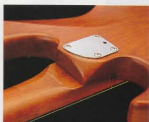
ROUND CUT HEEL 手のひらにフィットし、ハイポジションでの演奏性を向上させたラウンドカットヒールフィニッシュ。