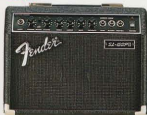
STUDIO LEAD 15 SP II