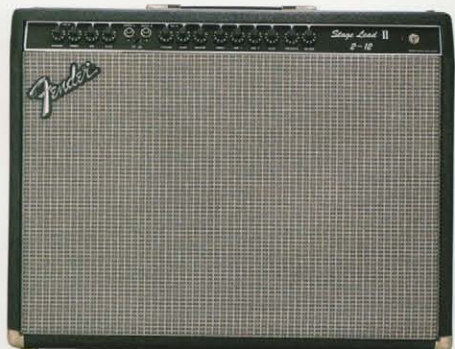
STAGE LEAD II 2-12