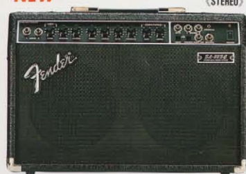
STUDIO LEAD 22 SC