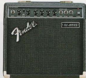
STUDIO LEAD 15 DX II