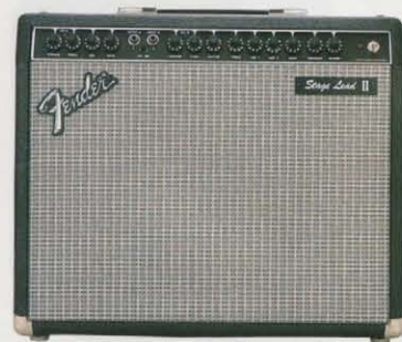
STAGE LEAD II 1-12