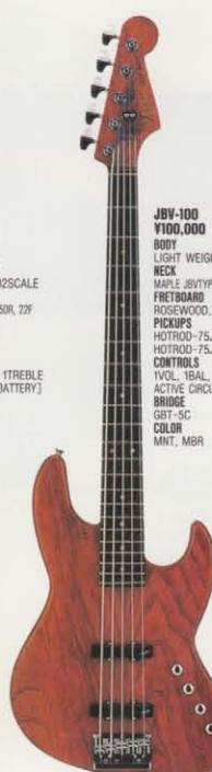
COLOR = MBR

JBR-106 ¥106,000 BODY LIGHT WEIGHT ASH NECK MAPLE JBR TYPE (MAT), 432SCALE FRETBOARD GRAPHITE REINFORCED FRETBOARD ROSEWOOD, 25OR, 22F PICKUPS HOTROD-7JF HOTROD-7JR CONTROLS 1VOL, 1BAL, 1BASS, 1TREBLE ACTIVE CIRCUIT [9V BATTERY] BRIDGE FBT-4C COLOR MNT, MBR