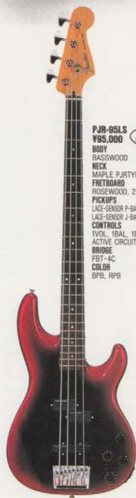
COLOR = RPB

印象的なシルエットのコンタドボディやスリムなナローネック、ワイドなトーンレンジのピックアップなどがジャズベースの特徴。そのフレキシブルなサウンドからあらゆるジャンルのベーシストに愛用されている。まさに完成されたサウンドを持つベースといえるのだ。しかし、クリエイティブなベーシストたちはこの完成されたサウンドにも満足せず、さらにハイレベルなものにするべく努力を重ねている。JBR、JBVはこのようなベーシストに対応させた基本に忠実なベースだ。