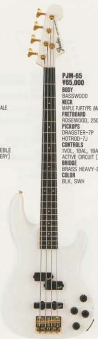
COLOR = SWH

PJR-95LS ¥95,000 * PICK UP MADE IN U.S.A. BODY BASSWOOD NECK MAPLE PJR TYPE, 432SCALE FRETBOARD ROSEWOOD, 25OR, 22F PICKUPS LACE-SENSOR P-BASS SILVER (USA) LACE-SENSOR J-BASS SILVER (USA) CONTROLS 1VOL, 1BAL, 1BASS, 1TREBLE ACTIVE CIRCUIT [9V BATTERY] BRIDGE FBT-4C COLOR RPB, RPB