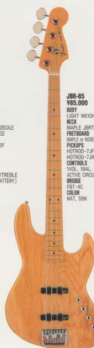
COLOR = NAT/M