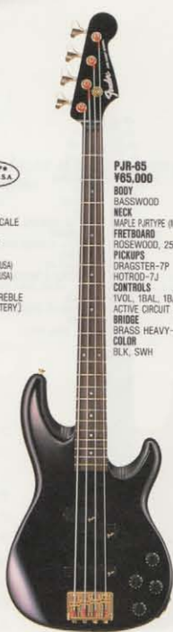
COLOR = BLK