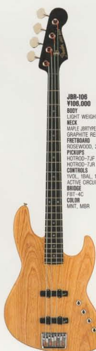
COLOR = MNT

GBT-5C BRIDGE スピーディな弦交換が行なえるクイックフックホールを装備したニューデザインの高張力用オリジナルブリッジ。